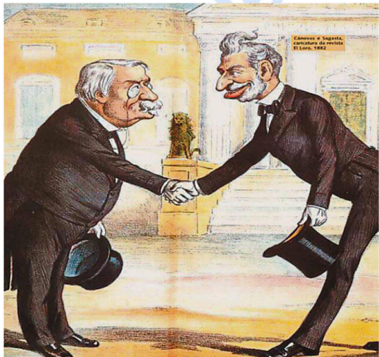
Antonio Cánovas y Práxedes Mateo Sagasta