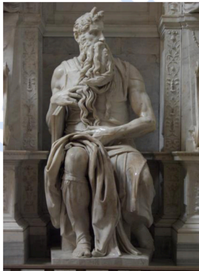
Lámina nº 3. Moisés (1509), Miguel Ángel Buonarroti, San Pietro in Vincoli, Roma.