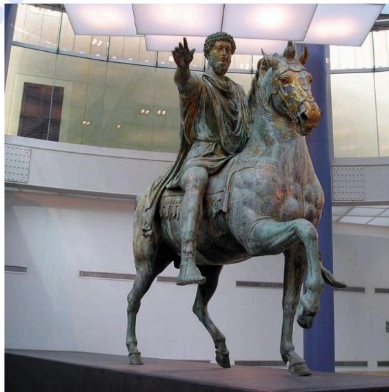
Lámina nº 1. Estatua ecuestre de Marco Aurelio (bronce, 176 d.C.), Museo Capitolino, Roma.