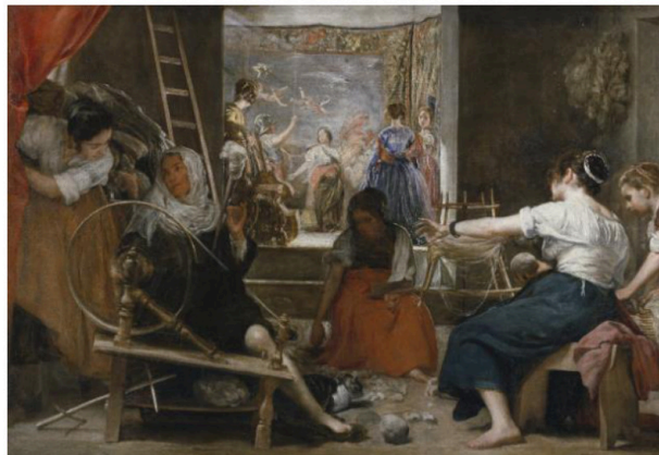
Lámina nº 4. Las hilanderas (c. 1657), Diego Velázquez, Museo del Prado, Madrid.