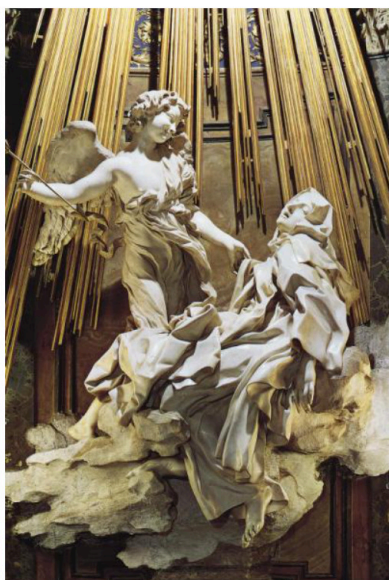
Lámina nº 2. El éxtasis de Santa Teresa (1647-1651), Gian Lorenzo Bernini, Santa María de la Victoria, Roma.