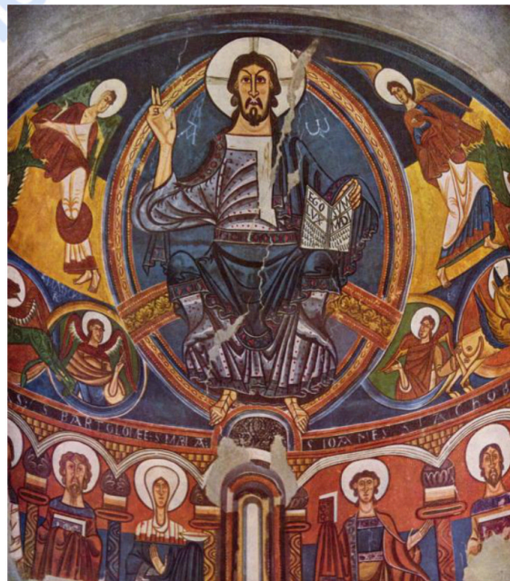
Lámina nº 1. Pantocrátor del ábside de San Clemente de Tahull (c. 1123), Maestro de Tahull, Museo Nacional de Arte de Cataluña, Barcelona.