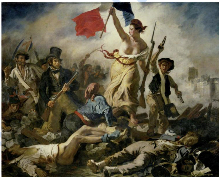
Lámina nº 3. La Libertad guiando al pueblo (1830), de Eugène Delacroix, Museo del Louvre, París.