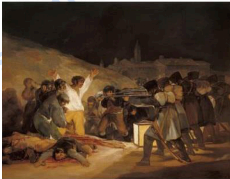
Nº 4. Los Fusilamientos (1814), de Francisco de Goya, Museo del Prado, Madrid.