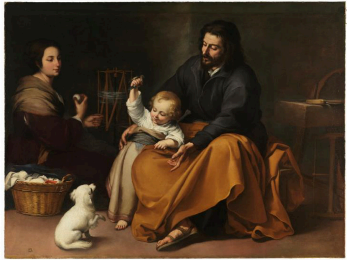
Nº 3. La Sagrada Familia del pajarillo (hacia 1650), Bartolomé Esteban Murillo. Museo del Prado. Madrid.