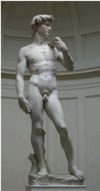
Nº 2. David (1501-1504), Miguel Ángel Buonarroti, Galería de la Academia, Florencia.