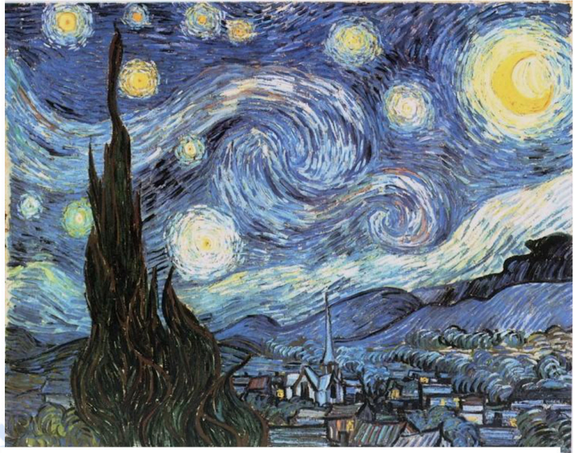
Lámina nº 3. La noche estrellada (1889), Vincent van Gogh, Museo de Arte Moderno de Nueva York.