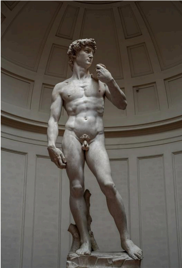
Lámina nº 2. David (1501-1504), Miguel Ángel Buonarroti, Galería de la Academia, Florencia.