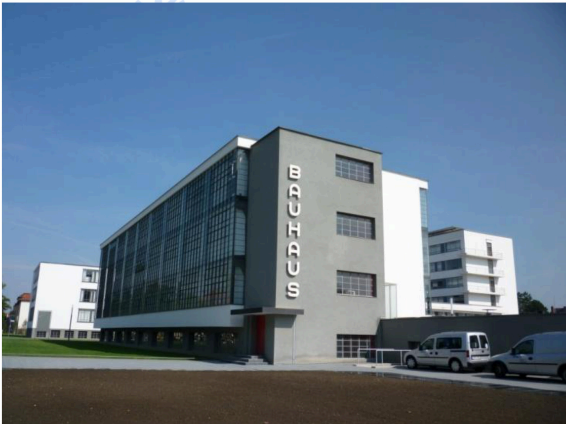
Lámina nº 4. La Bauhaus (1925-1926), Walter Gropius, Dessau (Alemania).