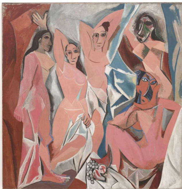
Lámina nº 4. Las señoritas de Avignon (1907), Pablo Picasso, Museo de Arte Moderno de Nueva York.