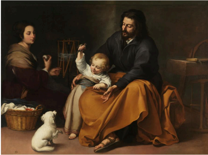
Lámina nº 2. La Sagrada Familia del pajarillo (hacia 1650), Bartolomé Esteban Murillo, Museo del Prado, Madrid.