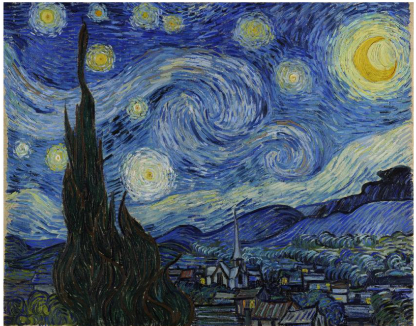
Lámina nº 3. La noche estrellada (1889), Vincent van Gogh.