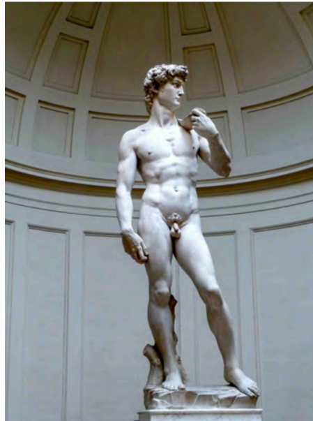
Miguel Ángel Buonarroti. David (1501-1504), Galería de la Academia, Florencia.