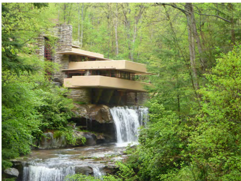
Lámina n.º 2. Frank Lloyd Wright. La casa Kaufmann o Casa de la cascada (1939), Mill Run (Pensilvania, Estados Unidos).