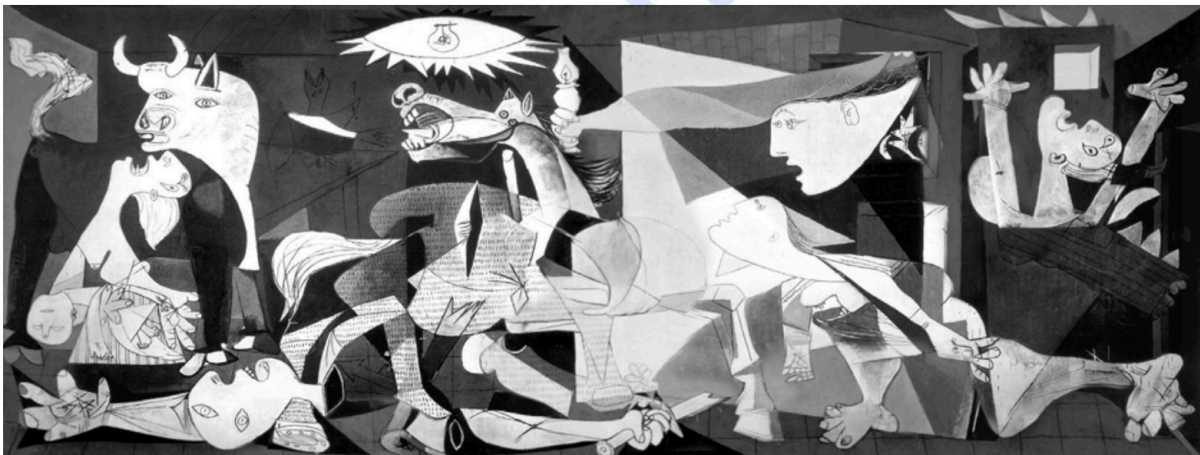
Lámina n.º 1. Pablo Picasso. Guernica (1937), Museo Nacional Centro de Arte Reina Sofía, Madrid.

5. Comentario de imagen. Elija UNA OPCIÓN de entre las dos propuestas (2 puntos).