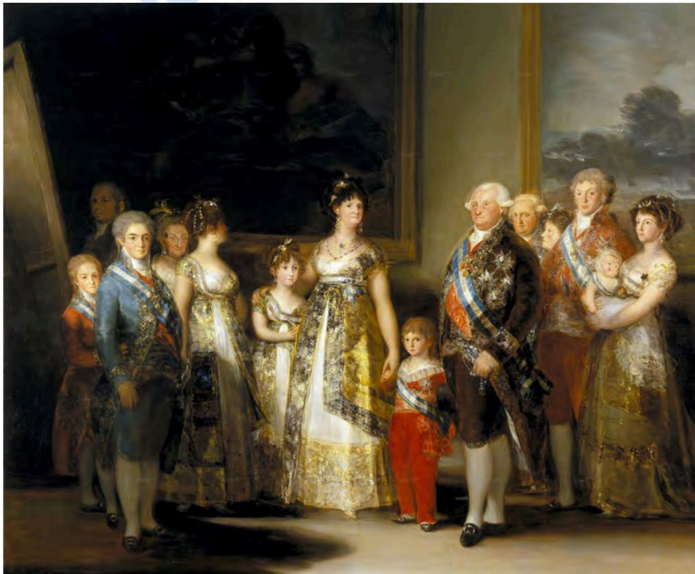
Lámina n.º 1. Francisco de Goya. La familia de Carlos IV (1801), Museo del Prado, Madrid.