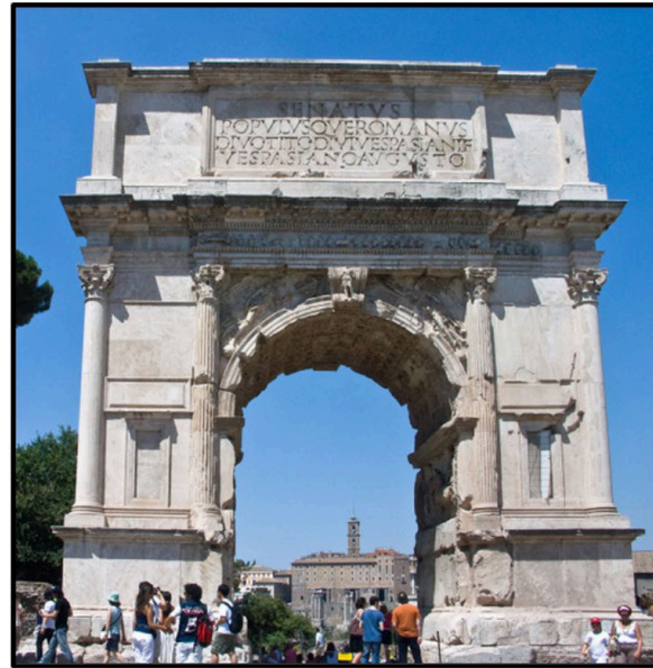
PREGUNTA 1 (2 puntos)