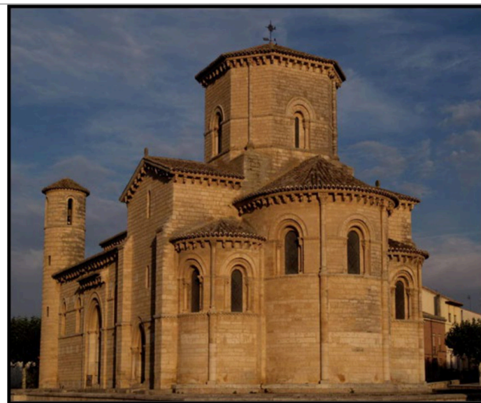
PREGUNTA 3 (2 puntos)