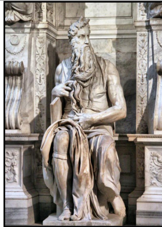
PREGUNTA 6 (2 puntos)