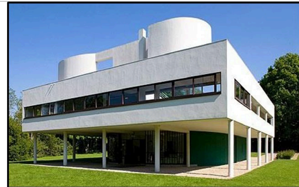
PREGUNTA 9 (2 puntos)