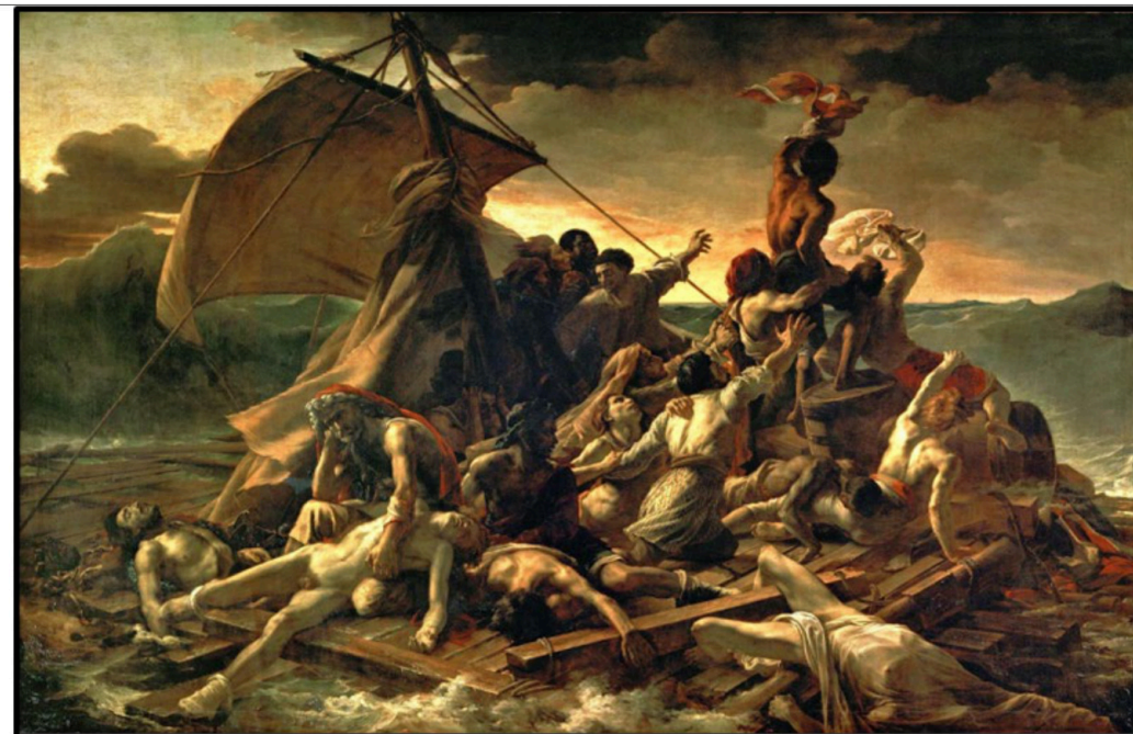
PREGUNTA 8 (2 puntos)