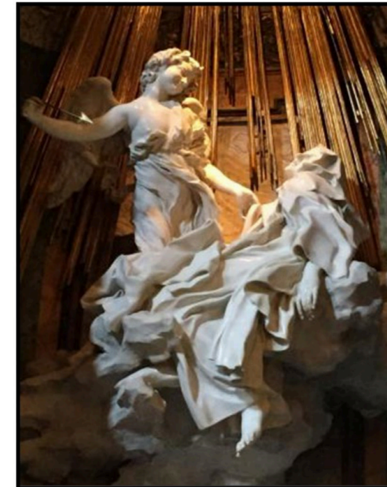
PREGUNTA 7 (2 puntos)