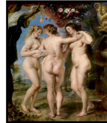
Pregunta 2 (2 puntos)