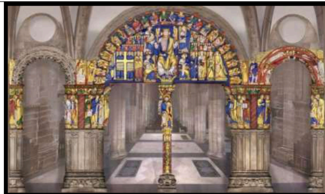
Pregunta 3 (2 puntos)