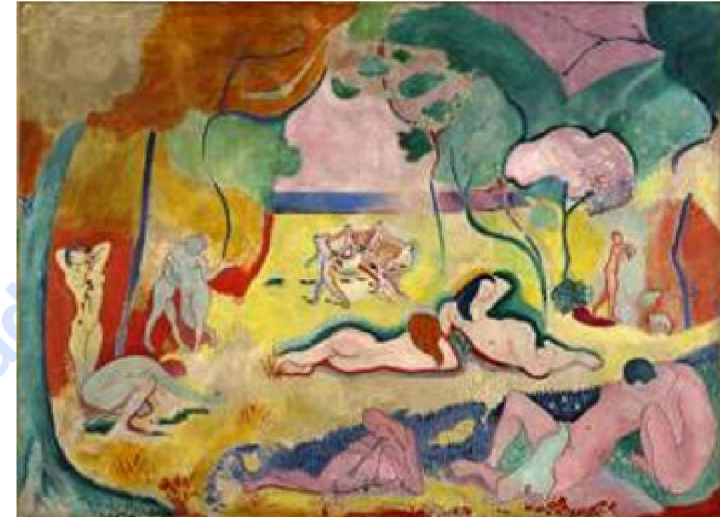
Pregunta 7 (2 puntos)