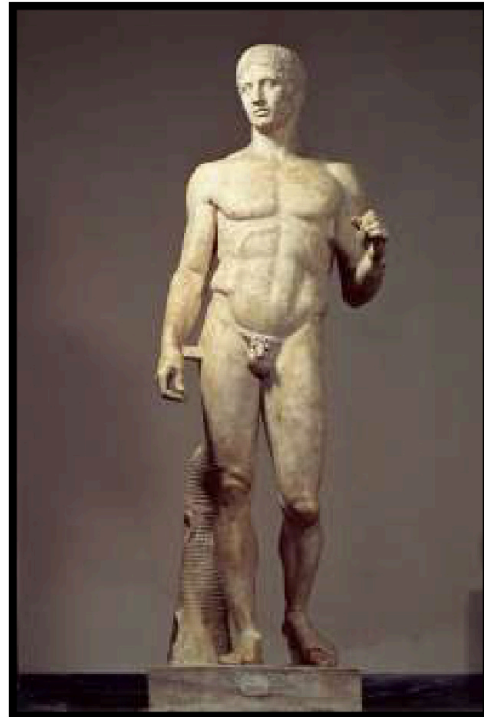
Pregunta 6 (2 puntos)