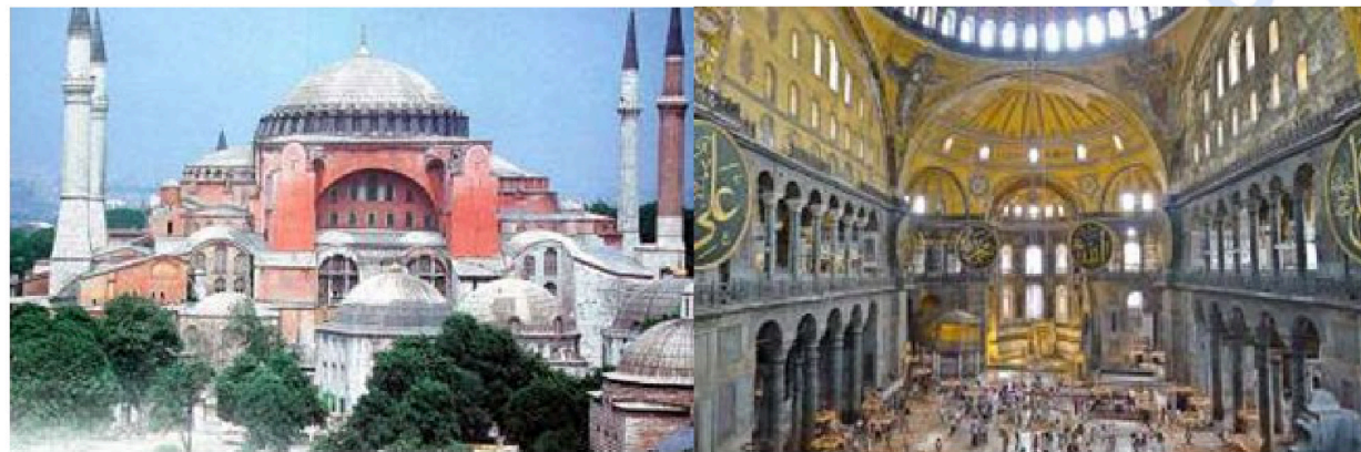
Pregunta 8 (2 puntos)