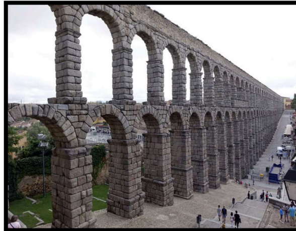
Pregunta 1 (2 puntos)