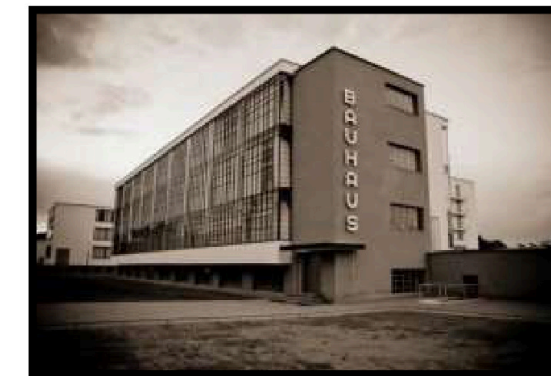
Pregunta 4 (2 puntos)