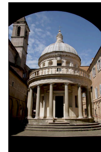
Pregunta 4 (2 puntos)