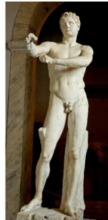
Pregunta 1 (2 puntos)