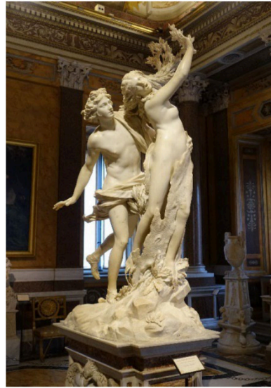
Pregunta 6 (2 puntos)