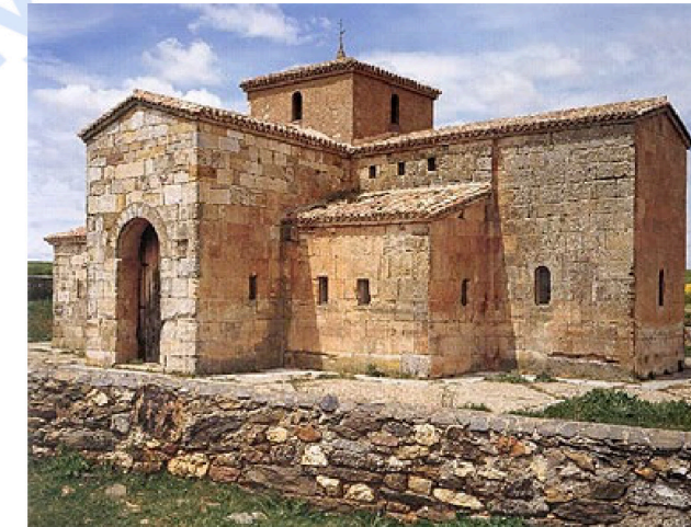
Pregunta 2 (2 puntos)