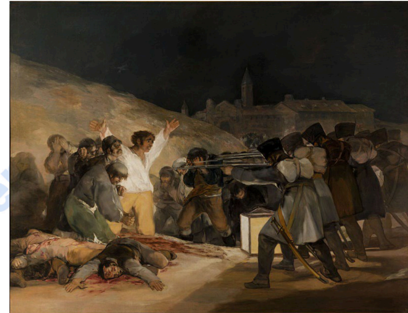
Pregunta 7 (2 puntos)