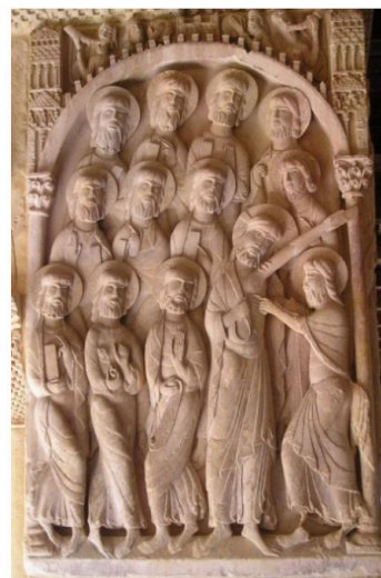
Pregunta 3 (2 puntos)