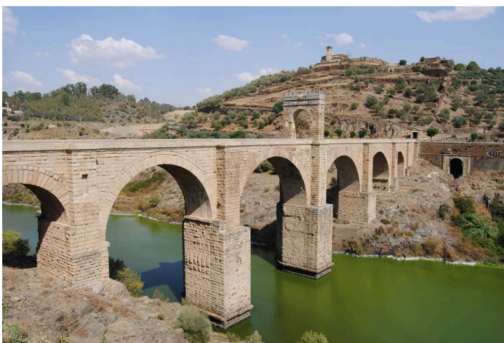
Imatge 2. Pont d'Alcántara, Càceres. Imagen 2: Puente de Alcántara, Cáceres. S. II d. C.