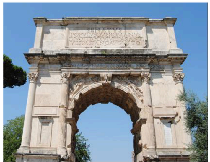
Imatge 3: Arc de Tit, Roma. Imagen 3: Arco de Tito, Roma. S. I d. C.