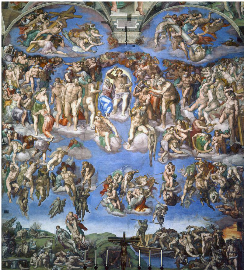
Imatge 5. Miquel Àngel. El judici final . Capella Sixtina (Roma, Vaticà), 1537-1541 Imagen 5: Miguel Ángel. El Juicio Final . Capilla Sixtina (Roma, Vaticano), 1537-1541