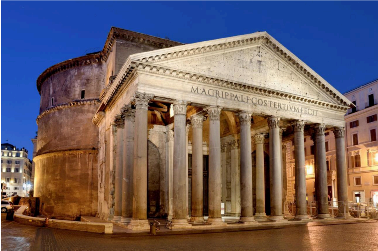
Imatge 1. Panteó, Roma Imagen 1: Panteón, Roma. S. II d. C.