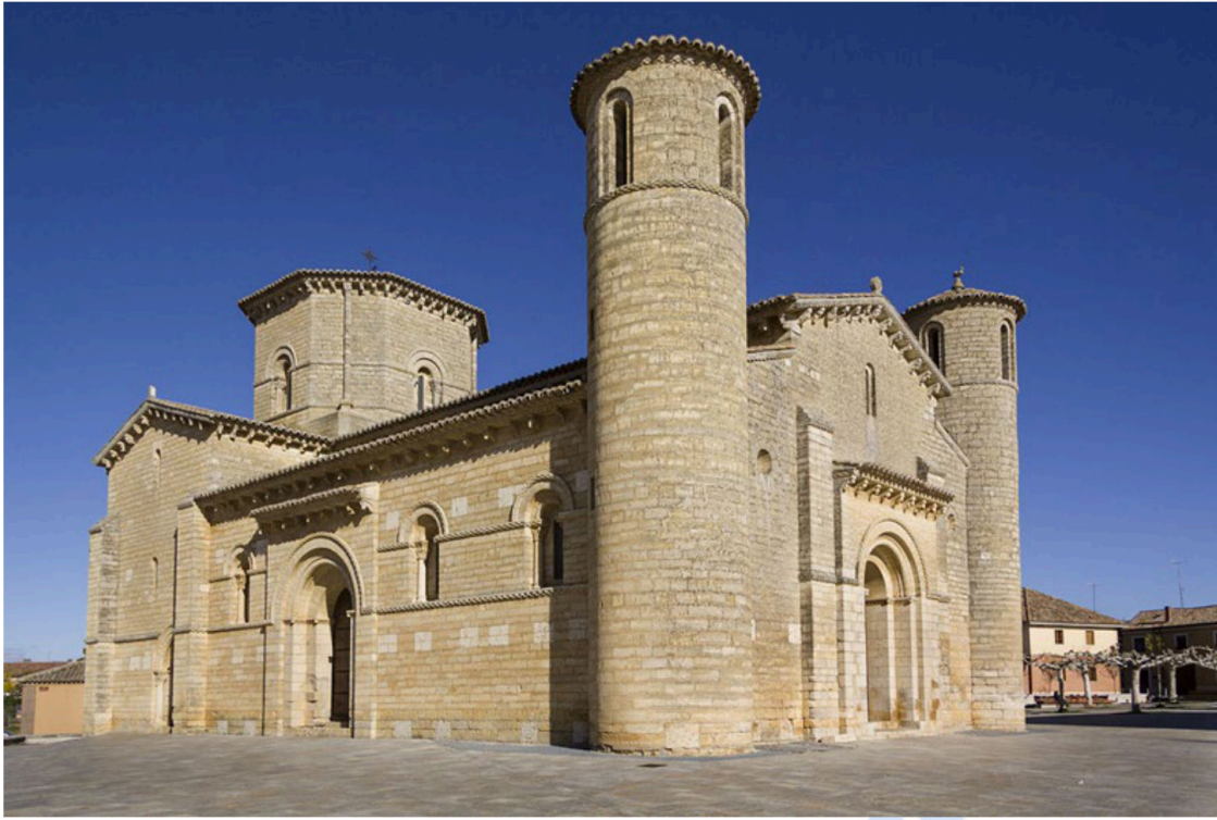
Imagen 1: Iglesia de San Martín de Frómista. S. XI. Imatge 1: Església de Sant Martí de Frómista. S. XI.