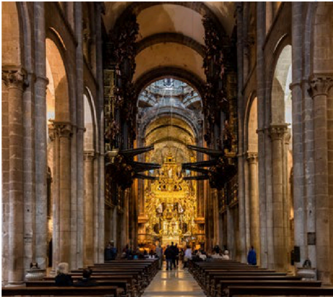
Imagen 2: Catedral de Santiago de Compostela (interior). S. XII. Imatge 2: Catedral de Santiago de Compostela (interior). S. XII.