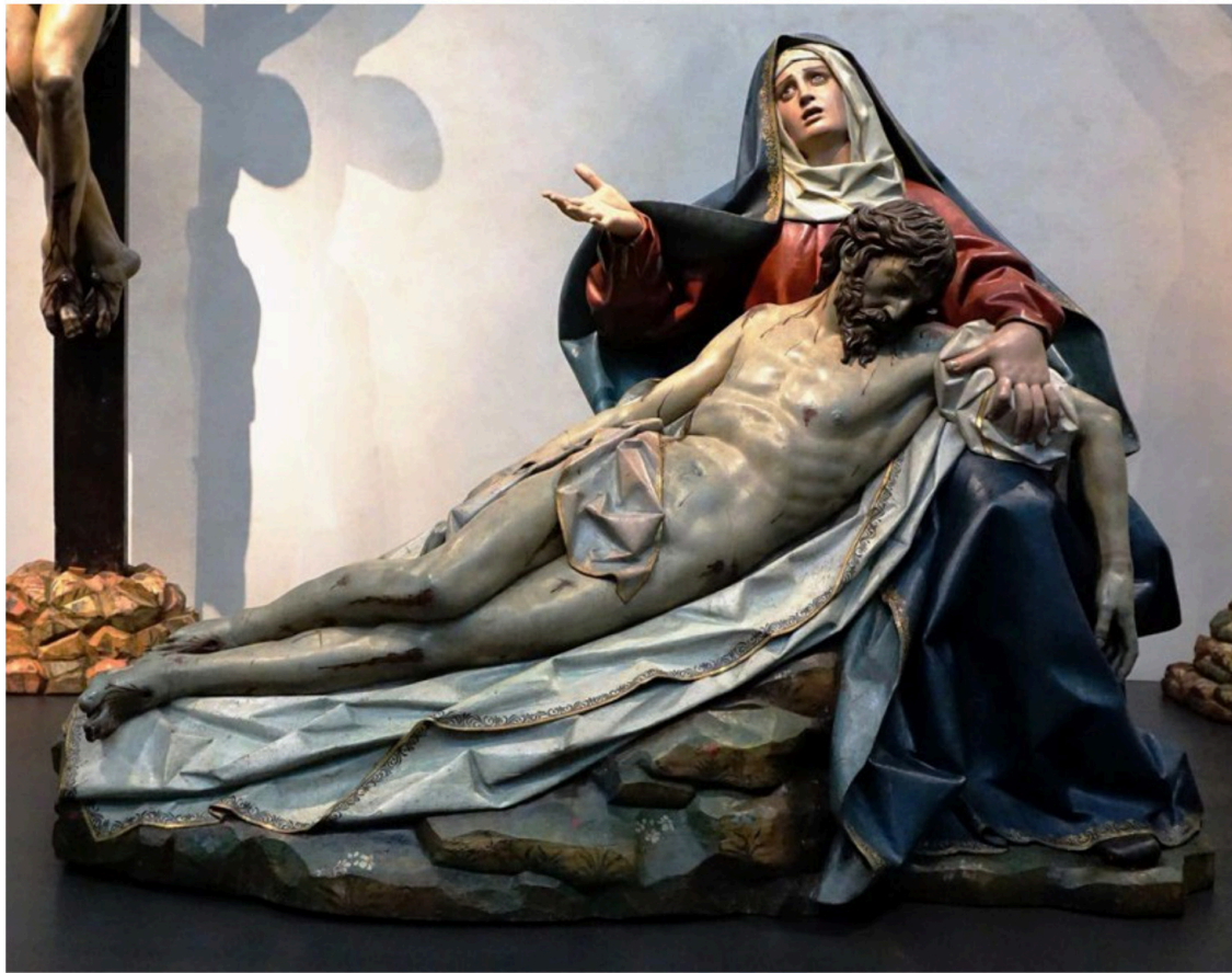
Imagen 4: Gregorio Fernández. 1616. Piedad . Imatge 4: Gregorio Fernández. 1616. Pietat .