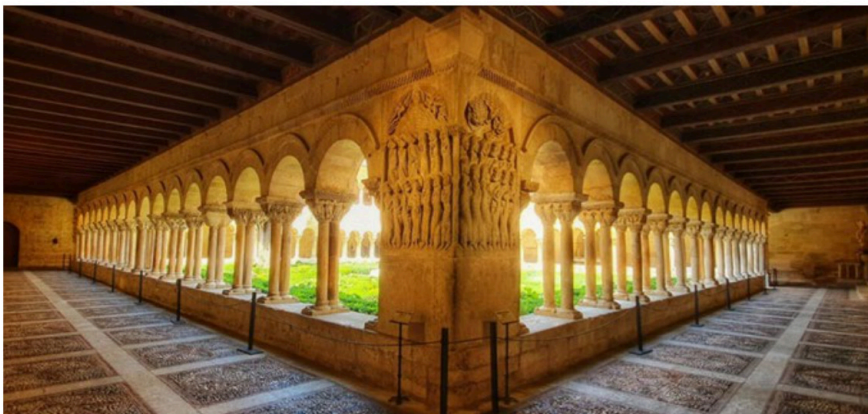
Imagen 3: Monasterio de Santo Domingo de Silos. Claustro. S. XI-XII. Imatge 3: Monestir de Santo Domingo de Silos. Claustre. S. XI-XII.