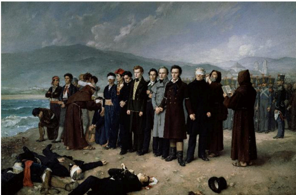
Antonio Gisbert Pérez. Fusilamiento de Torrijos y sus compañeros en las playas de Málaga. Museo del Prado.