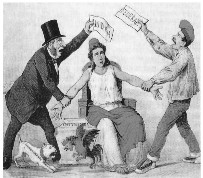
Documento 2. Diferencias políticas entre los republicanos. La Flaca, marzo de 1873.