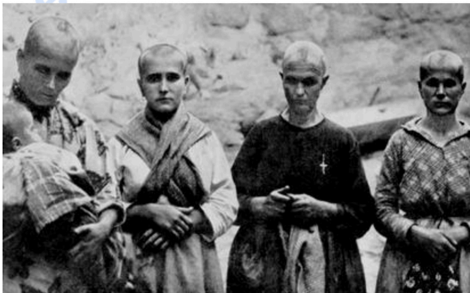
Mujeres rapadas en Oropesa (Toledo).