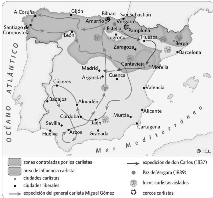
Documento 1. Mapa sobre la Primera Guerra Carlista (1833-1840).