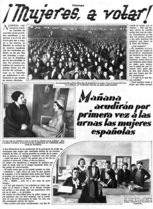
Documento 1. Reportaje de prensa sobre el sufragio femenino durante la II República.