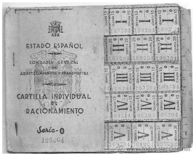
Documento 1. Cartilla de racionamiento.