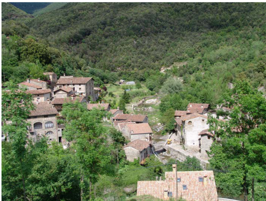
Paisatge de muntanya mitjana