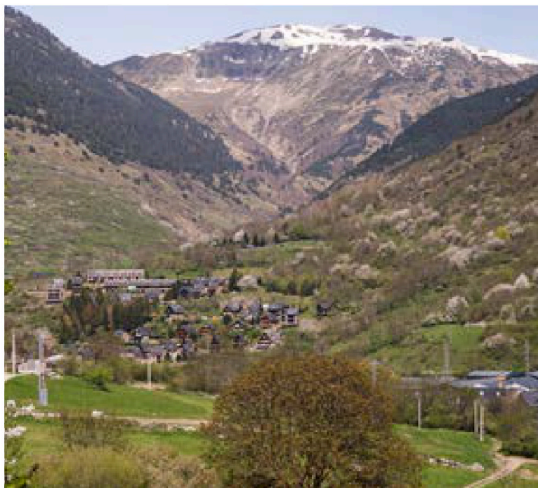
El paisatge dels Pirineus (Vilac, Vall d'Aran)