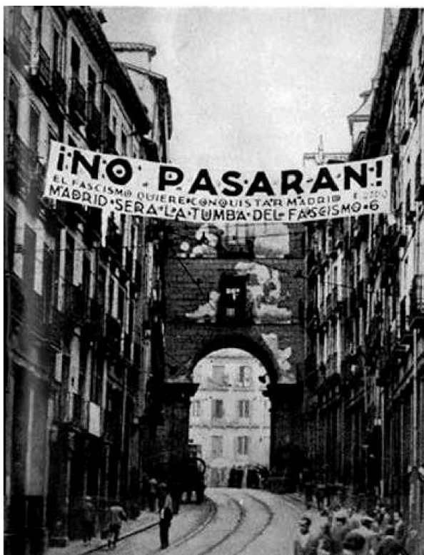
FONT: Prensa de Madrid, novembre del 1936.