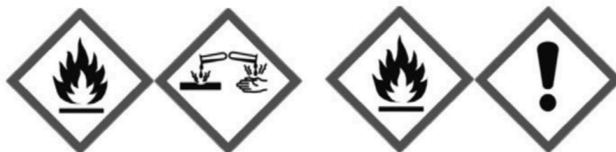
Pictograma 1 Pictograma 2 Ácido acético

Los envases de ácido acético y de etanol se suministran etiquetados con los pictogramas siguientes: