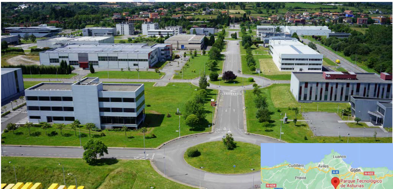
Figura 1: Parque Tecnológico de Asturias - Llanera (Asturias)

PREGUNTA 3. Análise de documento gráfico / Análisis de documento gráfico: