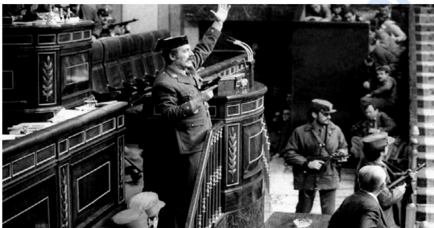
Teniente Coronel Antonio Tejero en el Congreso de los Diputados.