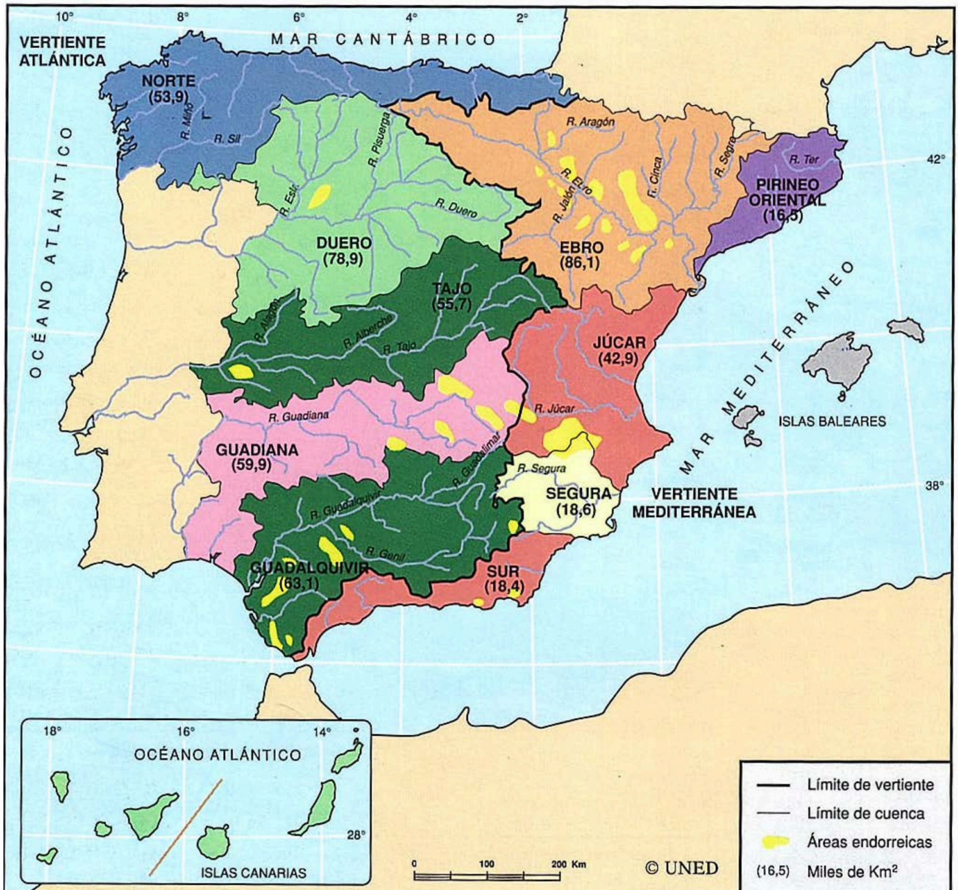
Figura nº1: Las vertientes y demarcaciones hidrográficas españolas