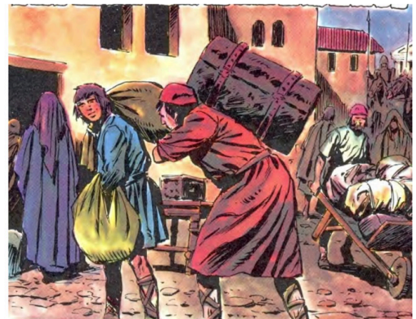
REPOBLADORES. HISTORIA DE ESPAÑA EN CÓMIC

A3. A partir de la conquista de Toledo por los cristianos en 1085, se produjo una nueva forma de repoblación respecto a la que hubo con anterioridad ("presura" o "aprisio"). Explica esa nueva forma de ocupación y reparto cristiano de las tierras conquistadas (1 punto).