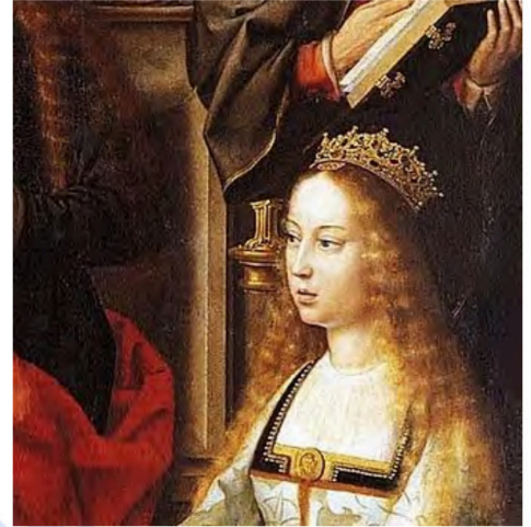
ISABEL I DE CASTILLA. RETABLO VIRGEN DE LA MOSCA. COLEGIATA DE STA. MARÍA LA MAYOR (TORO, ZAMORA)

A5. En 1474 Isabel de Trastámara se proclamó reina de Castilla en Segovia, pero de inmediato se declaró una guerra por el trono castellano. Explica en qué consistió esa guerra de sucesión por la Corona de Castilla, y quién apoyaba a una y otra facción (1 punto)