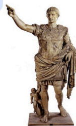
A. Augusto Prima Porta.