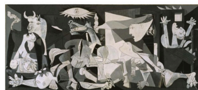
D. Gernika, Picasso.