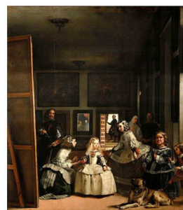
B. Meninas, Velázquez.