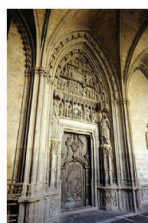
C. La Puerta Preciosa del claustro de la catedral de Pamplona