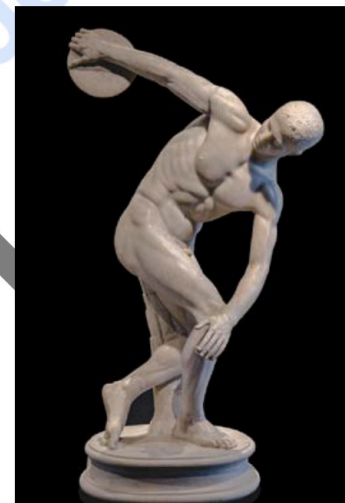
Mirón / Miron