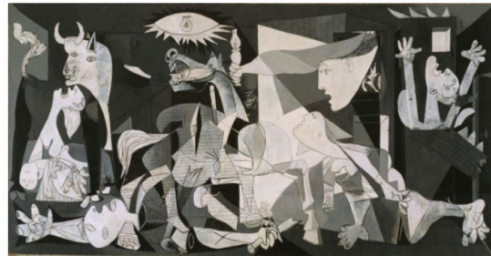
Pablo Picasso Gernika