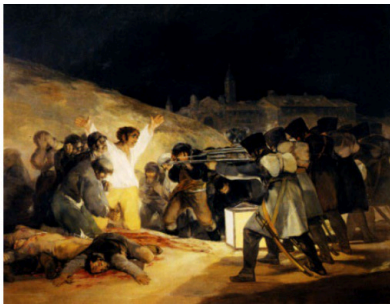
Francisco de Goya Los fusilamientos del 3 de Mayo/ Maiatzaren hiruko fusilamenduak