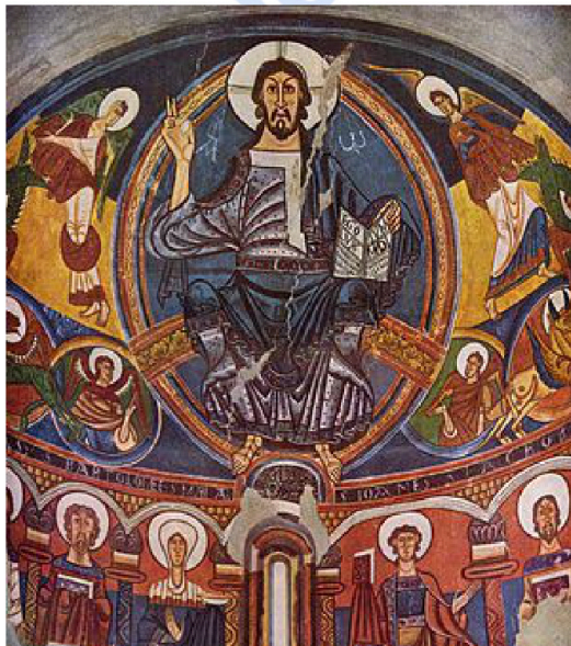
San Klemente Taüllgoa / San Clemente de Taüll

Filipe II.aren erretratua / Retrato de Felipe II