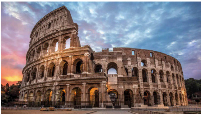
Erromako Koliseoa / El Coliseo de Roma

Iruzkindu irudi hauetako BI (2,5 puntu bakoitzak): Analiza DOS de estas imágenes (2,5 puntos cada una):