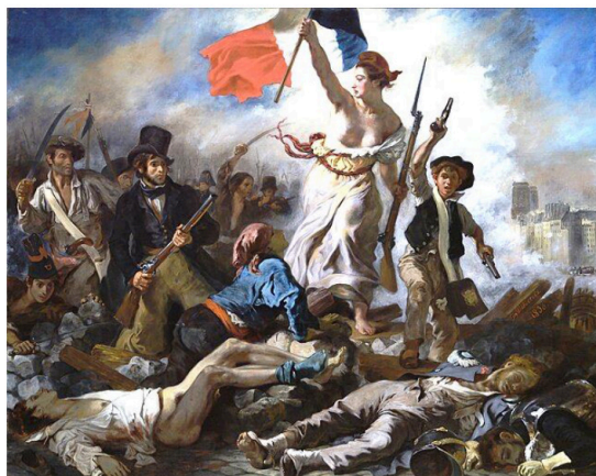
Eugène Delacroix. La Libertad guiando al pueblo / Askatasuna herriaren gidari.