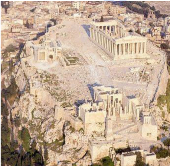
Atenasko akropolia /

Análisis de imágenes. Son cuatro imágenes y se deben analizar dos.