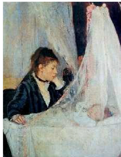
Berthe Morisot. Sehaska / La cuna