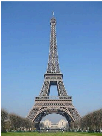
Eiffel dorrea / Torre Eiffel