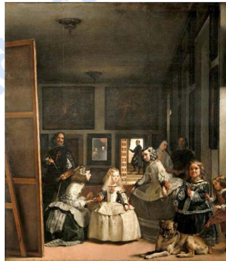
Velázquez. Meninak /