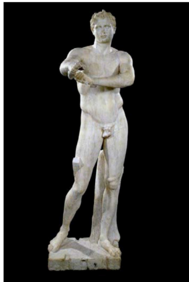
Lisipo: Apoxiomenoa / El Apoxiomeno Las Meninas

Análisis de imágenes. Son cuatro imágenes y se deben analizar dos.